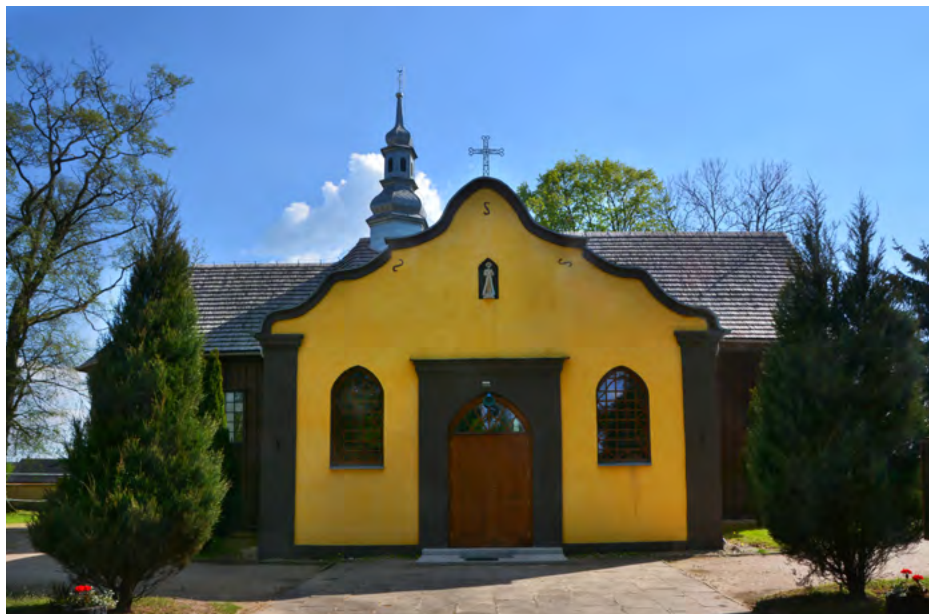
Elewacja północna, murowana kaplica z 1869 r.