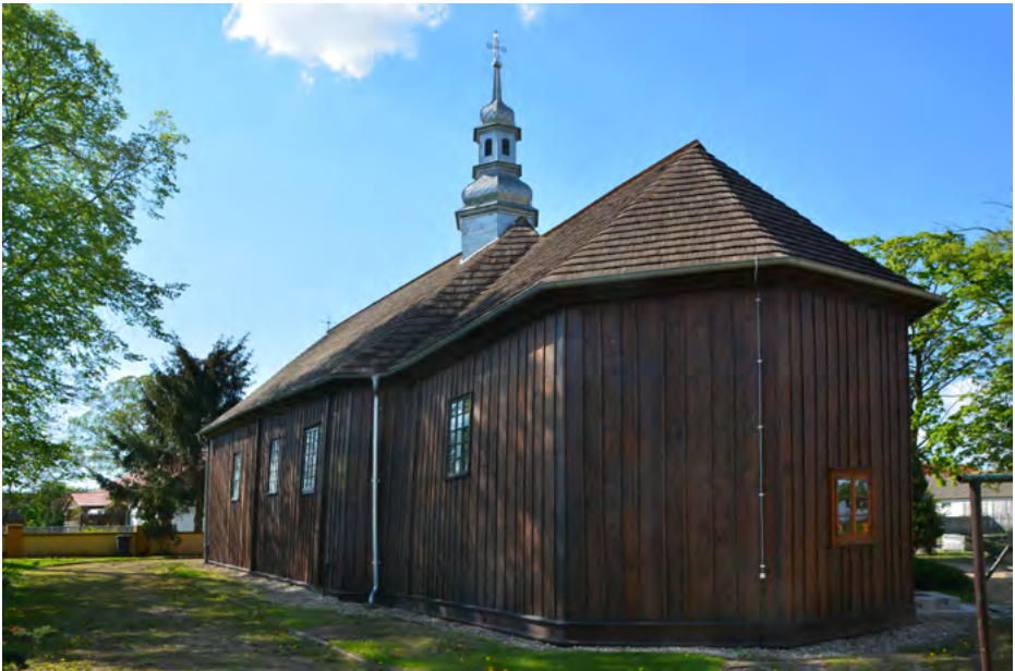
Elewacja wschodnia i południowa

Obok kościoła stoi dzwonnica o konstrukcji stalowej, jeden z dwóch dzwonów pochodzi z 1820 r.