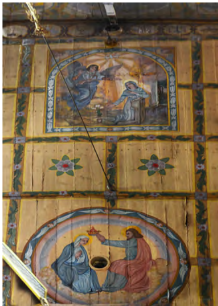
Polichromia na stropie w nawie