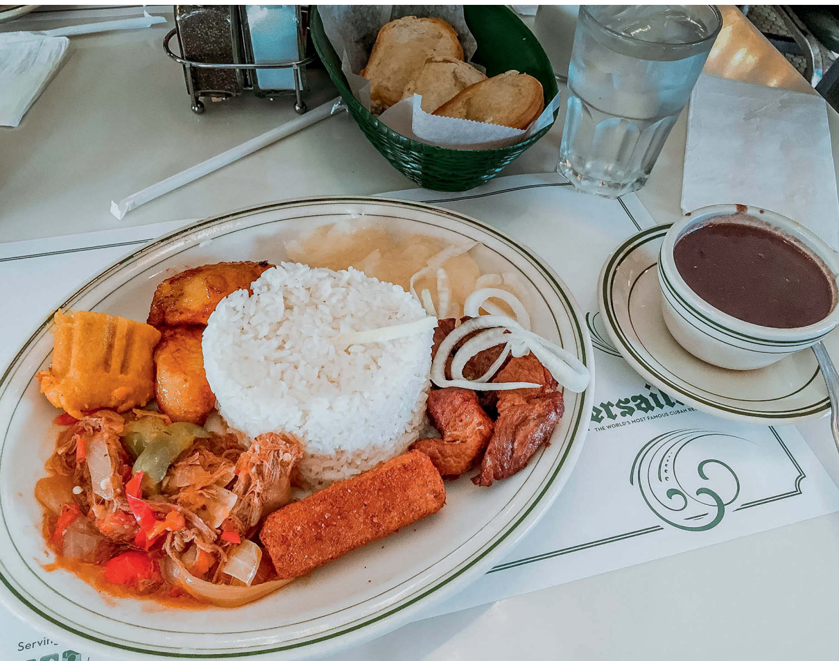
Kubańskie pyszności w restauracji Versailles