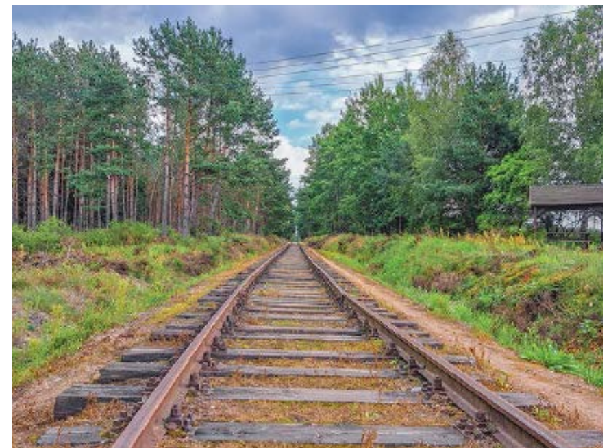
Tory wzdłuż szlaku

dbałość o bezpieczeństwo. I pewnie tak jest, bo można to zrobić zdecydowanie delikatniej. Rozwiązaniem, które może spełniać wymogi bezpieczeństwa, a jednocześnie nie szpecić, są drewniane przegrody, znane z Żelaznego Szlaku Rowerowego.