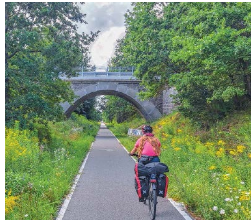
✚ Zabytkowy wiadukt kolejowy koło Przyrowa