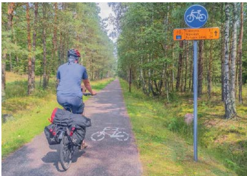
✚ Oznakowanie szlaku