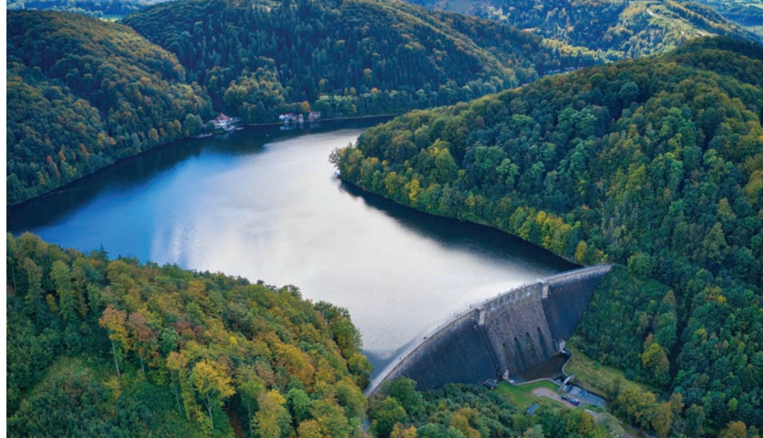
📍 Zapora w Lubachowie

Nasza wycieczka zaczyna się w górnej części jeziora, przy nowej kładce dla pieszych. Ma ona 126 m i została