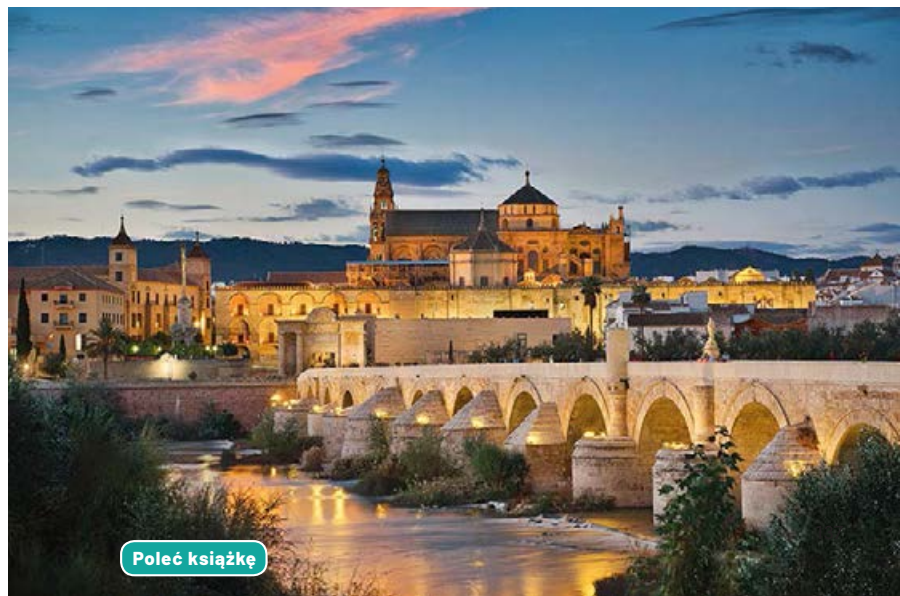
■ Panorama Kordoby

Po upadku władzy rzymskiej Kordoba znalazła się pod panowaniem Wizygotów, by w VIII w. wejść w skład świata islamu, co zapoczątkowało najświetniejszy okres w jej dziejach, zarówno pod względem politycznym, jak i kulturowym. Szczególny rozkwit nastąpił