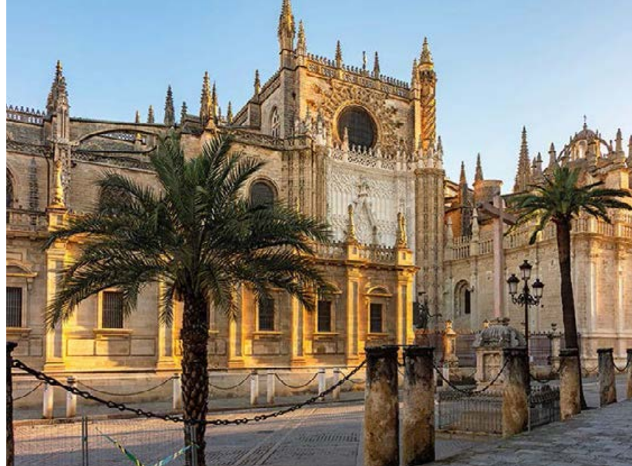
■ Katedra od strony Plaza del Triunfo

Prace przy budowie katedry rozpoczęły się około 1433 r., a jej główna struktura została ukończona i konsekrowana na początku XVI w. W 1987 r. katedra, wraz z Alkazarem oraz Głównym Archiwum Indii, została wpisana na listę światowego dziedzictwa UNESCO. Jej monumentalne rozmiary sprawiły, że rok później