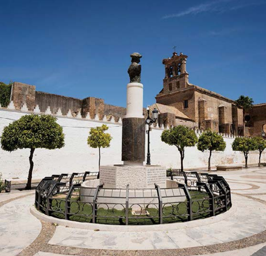
■ Monasterio de Santa Clara

miejsce to doskonale uświadamia materialny wymiar wyprawy i codzienne aspekty przygotowań.