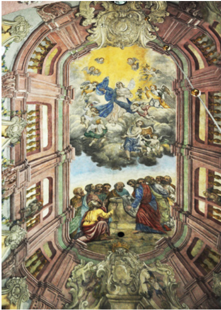
Sklepienie w prezbiterium, polichromia z 1861

Wyposażenie pochodzi z baroku, z XVII i XVIII w. Ołtarz główny powstał w 1643 r.