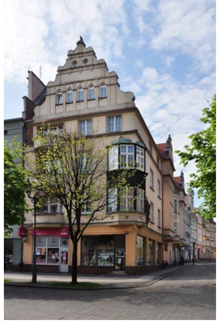
Jabłkowa 1, pierzeja południowa Rynku Jabłkowa 1 (elewacja zachodnia)