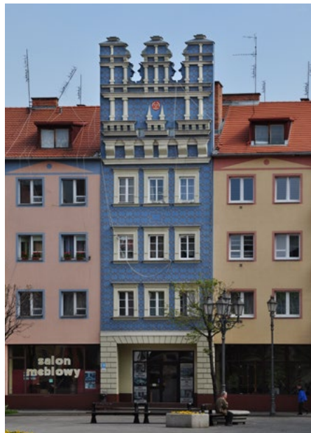
Rynek 18 (pierzeja północna)

Przy Ryнку zachowały się kamienice mieszczańskie.