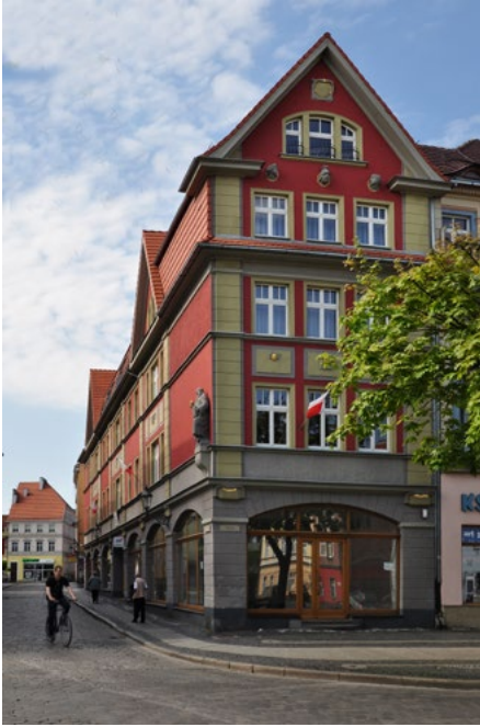
Kamienica z 1915, ul. Mieczna 2, pierzeja południowa Rynku Rynek 4