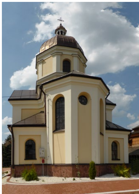
Elewacja wschodnia, prezbiterium z 2 zakrystiami

Kościół rzymskokatolicki pw. Narodzenia NMP to dawna cerkiew greckokatolicka, w stylu bizantyńskim, z 1921 r.