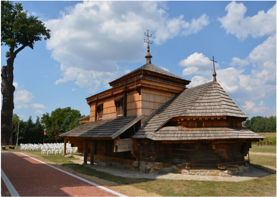
Elewacja wschodnia i północna