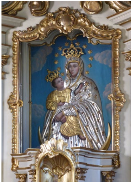
Obraz w ołtarzu głównym