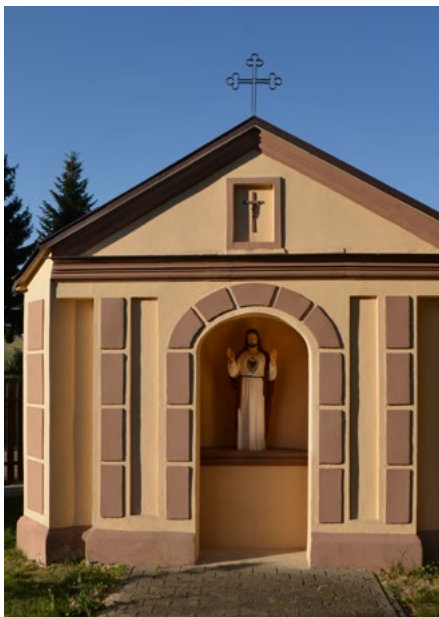
Kaplica Miłosierdzia Bożego