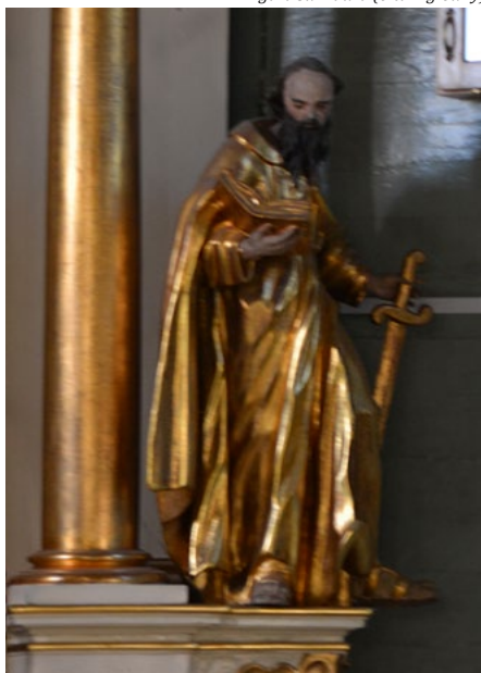
Figura św. Pawła (ołtarz główny)