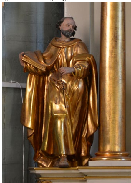
Figura św. Piotra (ołtarz główny)