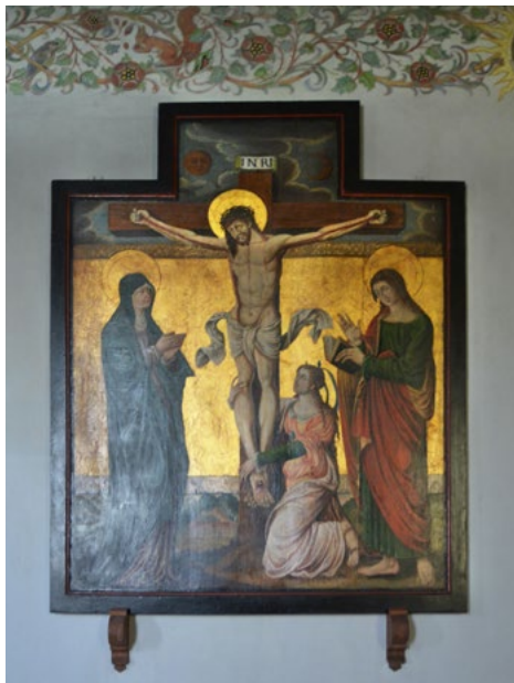
Ukrzyżowanie, ze środkowej części późnogotyckiego ołtarza skrzydłowego Drewniany strop w nawie, z lat 1916–1917