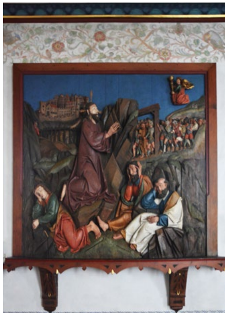
Jezus w Ogrójcu, z apostołami Piotrem, Jakubem (z prawej) i Janem Drzwi południowe, z polichromią

Zachowały się dwa dzieła z ok. 1530 r. – drewniana płaskorzeźba ukazująca Jezusa w Ogrójcu i obraz ze sceną ukrzyżowania.