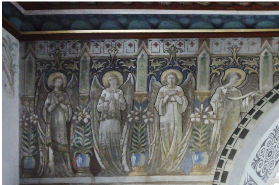
Polichromia na łuku tęczy

Polichromie nawiązują do secesji i motywów ludowych. Wykonał je tutejszy malarz Jean Rothenfluh (1871–1954).