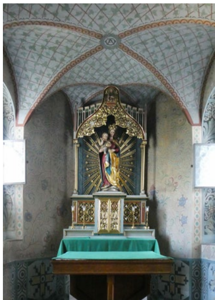
Absyda (prezbiterium), ołtarz z figurą Matki Boskiej

Wystrój wnętrza pochodzi z lat 1916–1917. W neogotyckim ołtarzu głównym jest figura Matki Boskiej, a w nawie Anioła Stróża z dzieckiem (z lewej) i Józefa z Dzieciątkiem (z prawej).