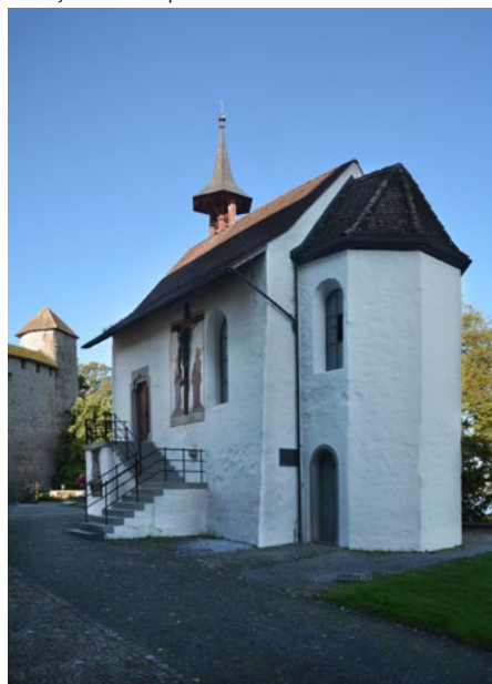
Elewacja wschodnia i południowa