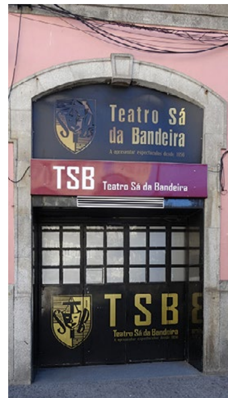
■ Teatro Sá da Bandeira

Pod sufitem ciągnie się pas kolorowych azulejos, które przedstawiają historię transportu w Portugalii. Pozostałe panele to sceny rodzajowe – takie jak zbiory winogron w dolinie Douro czy procesja z Matką Boską Uzdrowienia – ukazujące codzienne życie mieszkańców regionu.