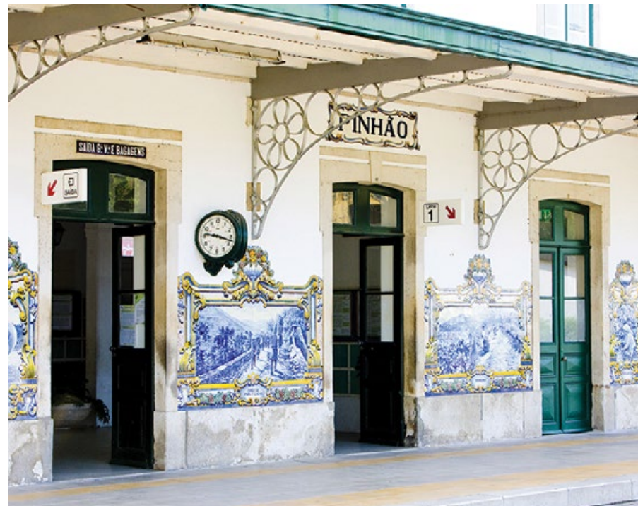
■ Dworzec główny w Pinhão

Idąc Rua do Castelo, niemiłosiernie dotrzeć do Castelo de Lamego. Zamek, wybudowany w stylach romańskim i gotyckim, został wzniesiony w początkach rekonkwisty tych terenów z rąk Maurów jako element systemu murów miejskich, które w średniowieczu otaczały miasto. Do dnia obecnego z pierwotnej konstrukcji zachowało się niewiele. W środku znajdują się kamienne cysterny służące kiedyś do gromadzenia wody. Dodatkowo w zamku można obejrzeć instalację multimedialną, która przybliży historię miasta.