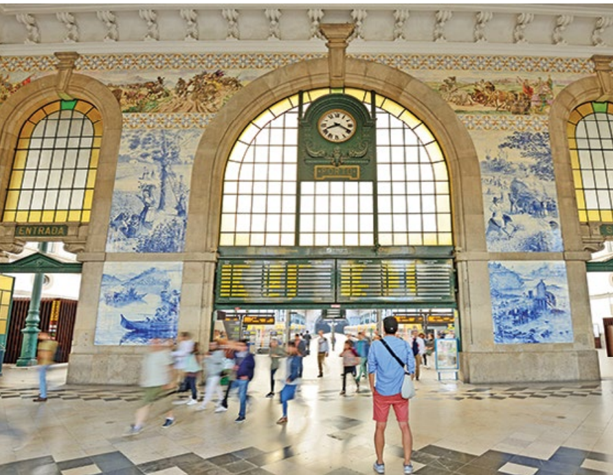
■ Dworzec św. Benedykta