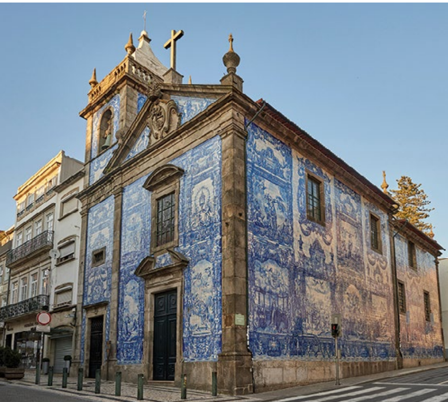
■ Kaplica Dusz

miłośników architektury, a smakoszy przyciąga kolorami i zapachami. Targ ma cztery główne bramy – po jednej z każdej strony. Nad główną bramą od Rua