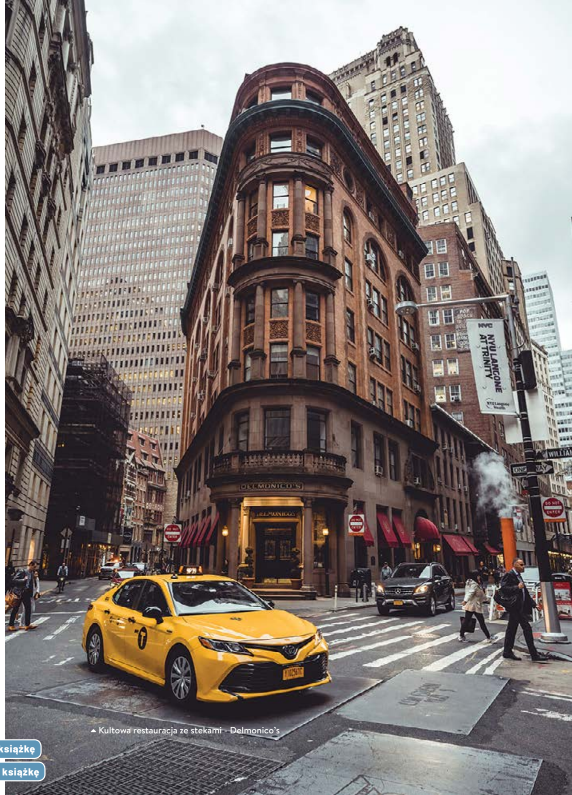
▲ Kultowa restauracja ze stekami – Delmonico's

Będąca obiektem licznych ujęć fotografów kładka łączy dwie sąsiadujące kamienice – jedną położoną przy 67 Hudson Street, a drugą leżącą przy ulicy 7 Jay. Ciekawa jest również historia tych obiektów, które w dawnych latach pełniły zupełnie inne funkcje, a wiszący na 3. kondygnacji przesmyk ułatwiał przemieszczanie się między nimi. Co to były za budynki?