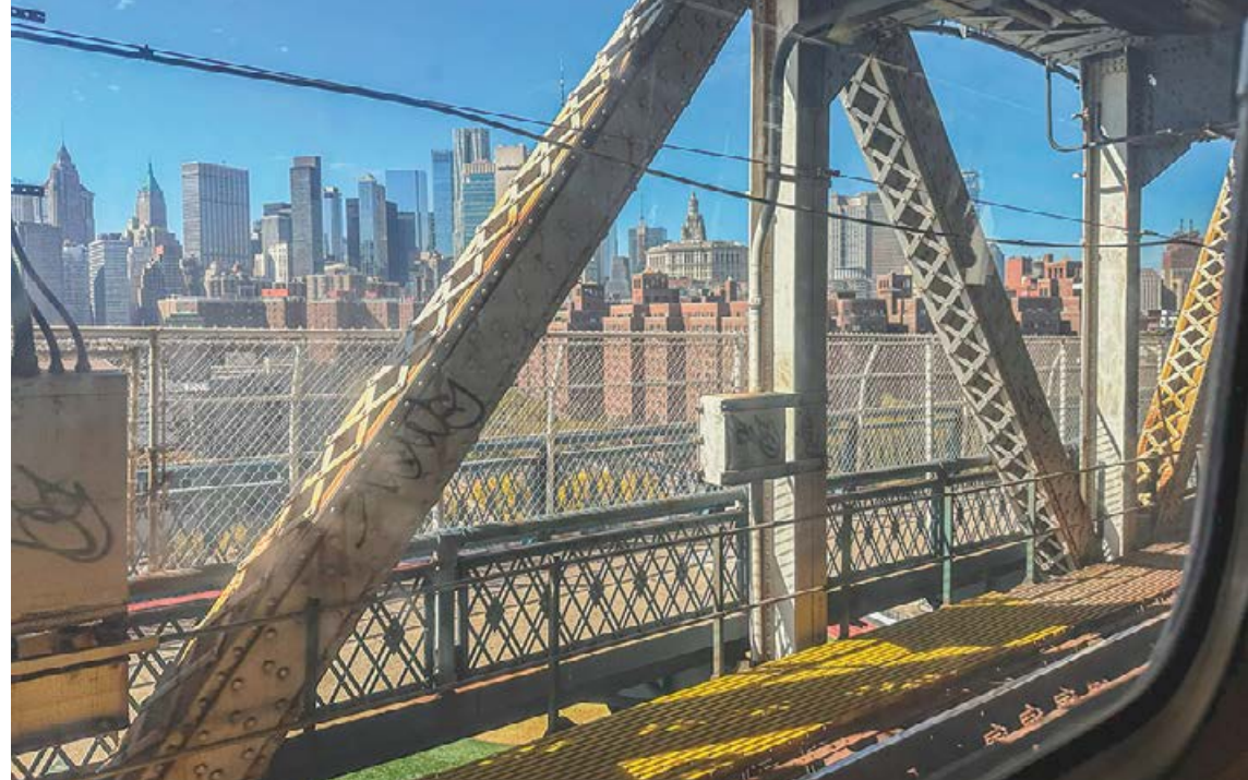
▲ Nowy Jork widziany z okna metra

popularnością w Nowym Jorku cieszyły się wyścigi konne, a zwycięzcom wręczane były okazałe nagrody. Wówczas w artykule sportowego dziennikarza, Johna Fitzgeralda, znalazła się wzmianka, jakoby zdobycie trofeum było wyczynem porównywalnym do największej z możliwych wygranych, którą autor określił mianem „wielkiego jabłka”. A to wszystko na łamach poczytnego „New York Morning Telegraph”.