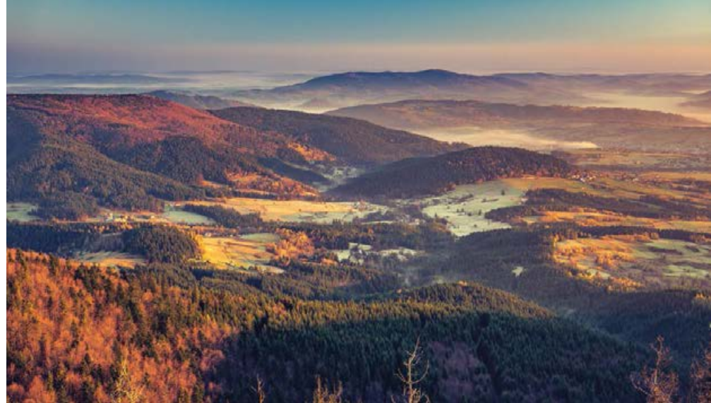
↗ Widok z masywu Mogielicy na Beskid Wyspowy

Ta niedługa wycieczka (ok. 5 godz.) wymaga wysiłku ze względu na ponad 600 m przewyższenia, dlatego może męczyć młodsze dzieci. Mamy jednak cały dzień na to, by zdobyć Mogielicę, więc do woli możemy odpoczywać w wielu wyjątkowo malowniczych miejscach na trasie! Niespodzianką jest zejście od Wyrębisk do Szczawy bez znakowanego szlaku – jednak wyraźną drogą, która nie nastęrcza większych trudności w orientacji. Na trasę warto wziąć zapas wody i prowiant.