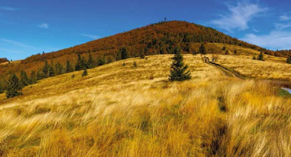
↗ Widok na Mogielicę z hali pod szczytem

Gdy służyła do wypasu owiec, była jeszcze pokaźniejsza, obecnie stopniowo zarasta. Mimo to wciąż zapewnia ciekawe widoki na zalesione górskie szczyty. Pięknie prezentują się zwłaszcza Gorce, zza których przy ładnej pogodzie wylaniają się Tatry. Trawiaste przestrzenie hali kuszą, by rozsiąść się tu na chwilę odpoczynku i chłonąć górską atmosferę!