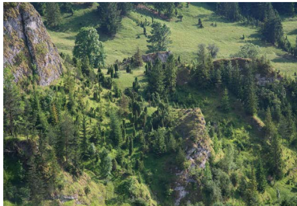
▲ W rezerwacie „Biała Woda”

Od parkingu przed wylotem wąwozu Homole droga prowadzi przez wieś Jaworki do doliny potoku Biała Woda. Wiedzie tam początkowo czerwony szlak pieszy, a następnie żółty – w miejscu, gdzie się rozpoczyna, zobaczymy wyrastające z łagodnych zboczy niespodziewanie strome wapienie. To skały Smolegowa i Czubatka , a szlak żółty wiedzie do urokliwego wąwozu Międzyskały . Płynący potok tworzy kaskady i „baniory” (tak nazywane są tu kotły eworsyjne pod wodospadami). Pamiętajmy, że na skałki nie wolno się wspinać! To teren rezerwatu „Biała Woda” , a na skałkach rośnie wiele rzadkich roślin – w tym kilka gatunków górskich, które poza Tatrami właśnie tu mają swe jedyne w Polsce stanowiska.