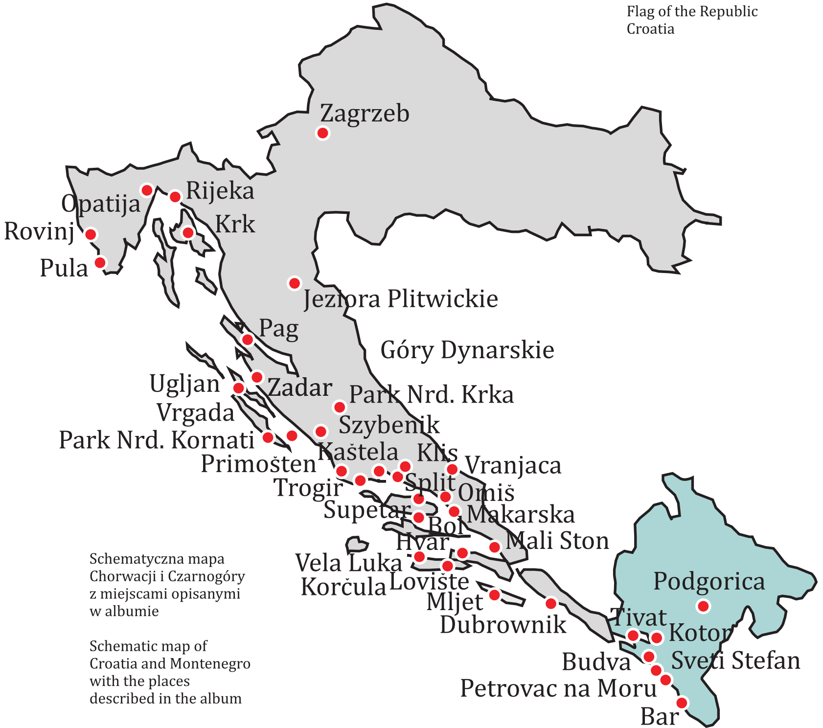
Schematyczna mapa Chorwacji i Czarnogóry z miejscami opisanymi w albumie