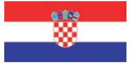
Flaga republiki Chorwacji