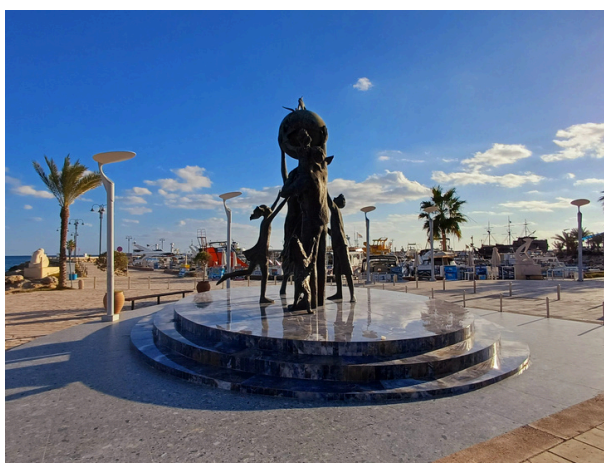
Pomnik Operacji Pokojowej na Cyprze

Cypr to wyspa, która zachwyci nas kuchnią, kulturą i przyrodą zupełnie odmienną od tego, co znamy z naszego rodzimego podwórka. Jednocześnie to wszystko jest na wyciągnięcie ręki, bo na Cypr dolecimy z Polski w zaledwie 3,5 godziny! Wyjazd tutaj to więc świetny pomysł zarówno na pierwszą, jak i kolejną samodzielną eskapadę.