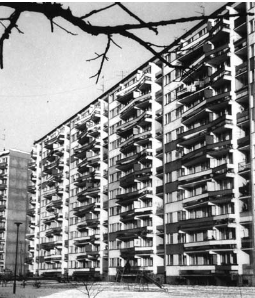
Blok „mrówkowiec” na wrocławskim osiedlu Popowice 1981