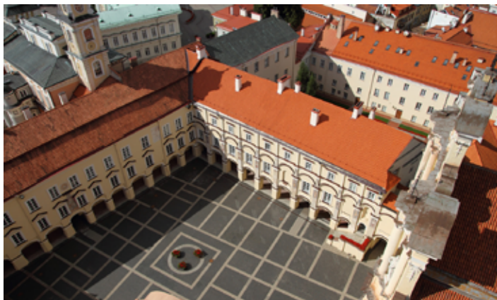
▲ Uniwersytet Wileński – plac arkadowy

były król Stanisław August (1797), Ludwik XVIII (1804) – późniejszy król Francji, pruski król Wilhelm (1812) i car Aleksander I. W latach 1863–65 w pałacu rezydował generał-gubernator Michaił Murawjow, przewany Wieszatielem za krwawe stłumienie powstania styczniowego na Litwie. W okresie międzywojennym, kiedy to Wilno znajdowało się w granicach II Rzeczypospolitej, w pałacu przebywali z kolei prominentni politycy polscy z marszałkiem Józefem Piłsudskim na czele. Zatrzymywali się tu m.in. Lucjan Żeligowski, Stanisław Wojciechowski i Ignacy Mościcki.