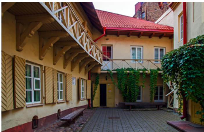
▲ Dziedziniec Muzeum Adama Mickiewicza

petersburskiego „Kwartalnika Litewskiego”, przybył do Wilna i zajął się zbieraniem eksponatów do mickiewiczowskiego muzeum. Obecna placówka rozpoczęła swą działalność w roku 1955 dzięki wysiłkom pracowników Uniwersytetu Wileńskiego, pod którego patronatem funkcjonuje do dzisiaj. W zbiorach muzeum znajdują się m.in. pierwsze wydania utworów wieszca, a także jego rzeczy osobiste.