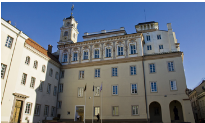
▲ Główny gmach Biblioteki Uniwersyteckiej

bibliotekę, wydziały historyczny i filologiczny (w tym filologię polską), a także uniwersytecki kościół św. Jana.