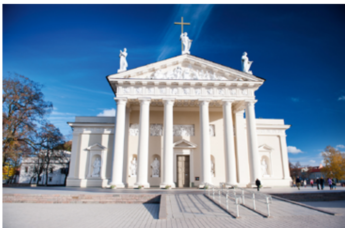
▲ Monumentalna fasada katedry wileńskiej

W XVIII w., na skutek nadwężenia murów katedry, biskup Ignacy Massalski zlecił przebudowę świątyni – dokonano jej pod kierownictwem wybitnego architekta Wawrzyńca Stuoki-Gucewicza. Budowla nabrała wyglądu klasycystycznego (zarówno jeśli chodzi o elewację, jak i wykończenie wnętrza), zachowując nadal gotycką bryłę. To była ostatnia znacząca przebudowa świątyni. Gmach zyskał sześciokolumnowy dorycki portyk,