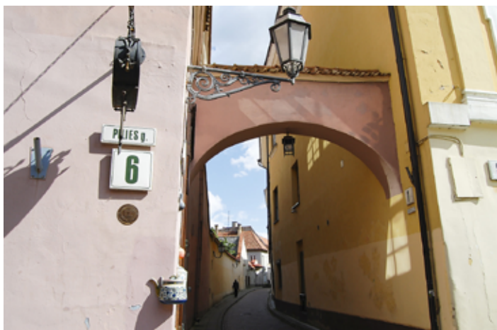
▲ Zaułek Bernardyński