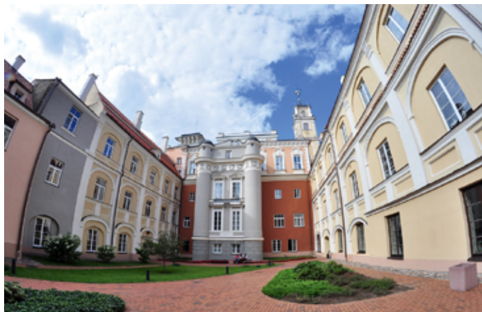
▲ Dziedziniec Obserwatorium

ulg. 1,20 EUR; czas trwania: ok. 1,5 godz., grupa min. 4-os. wznosi się przy placyku przylegającym do ulicy Uniwersyteckiej. Do połowy XIX w. dziedziniec był oddzielony od ulicy murem. Gmach biblioteki powstał w końcu XVI w., zaś w połowie XVIII stulecia dobudowano najwyższą kondygnację budynku, zwieńczoną wieżą obserwatorium astronomicznego i przyozdobioną malowidłami przedstawiającymi motywy astronomiczne. W rogu gmachu, od strony ulicy Uniwersyteckiej, stoi pomnik wybitnego XVIII-wiecznego poety litewskiego Kristijonasa Donelaitisa.