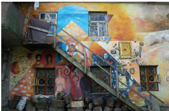
▲ Artystyczny dom na Zarzeczu