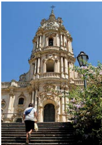
▲ Katedra San Giorgio

Na północ od zamku dalej wznosi się przepiękna ★ katedra św. Jerzego (San Giorgio). Stoi ona na szczycie widowiskowych 250 schodów. Robi imponujące wrażenie, zwłaszcza z oddali. Jej twórcom udało się wyjątkowo ciekawie zespolic koncepcje architektoniczne, scenograficzne i urbanistyczne. Wybudowana w XI w., zniszczona przez trzęsienie ziemi w XVII w., została przebudowana w XVIII stuleciu w stylu barokowym. W obrębie jej pięciu naw odnajdziemy wiele dzieł sztuki, m.in. poliptyk Girolamo Alibrandiego z 1513 r., posąg Madonna