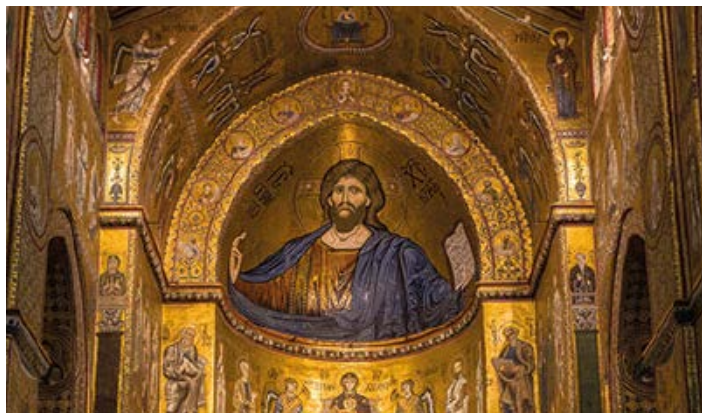
▲ Chrystus Pantokrator

Klasztorny ogród został odnowiony w 1997 r. Mały krużganek znajduje się w południowo-wschodniej części kompleksu, zdobi go fontanna (nazywana fontanną Królewską ), która składa się z okrągłej misy i rzeźbionego w zygzaki trzonu, zakończono go 12 paszczami lwów. Prawdopodobnie pełniła ona funkcję chrzcielnicy.