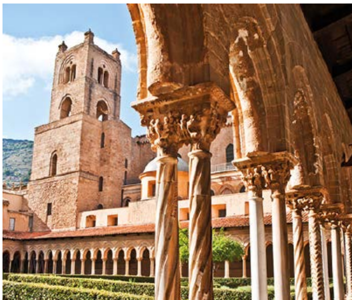
▲ Krużganki i dzwonnica katedry

otwartą księgę, w której możemy przeczytać po łacinie albo po grecku słowa: „Ja jestem światłością świata, kto idzie za mną, nie będzie chodził w ciemności”. Przenikliwie, ale i łagodne spojrzenie Pantokratora podąża za nami wszędzie. Równie niezwykłego uczucia można doświadczyć, podziwiając mozaikę z obu stron absydy. Sąd niebiański namalowany pod Pantokratozem wychwala Matkę Bożą, która siedzi pośrodku, trzymając błogosławione Dziecię na rękach. Mozaiki są największym skarbem katedry. Na ścianach centralnej nawy przedstawiają sceny ze Starego Testamentu. Drewniany sufit , reprezentujący czysty styl arabski, nad nawą centralną ma dwa nachylenia, nad bocznymi nawami jest pojedynczy. Został zrekonstruowany po pożarze w 1811 r., ale jest dobrą reprodukcją oryginalnych motywów dekoracyjnych i pierwotnych wzorów geometrycznych.