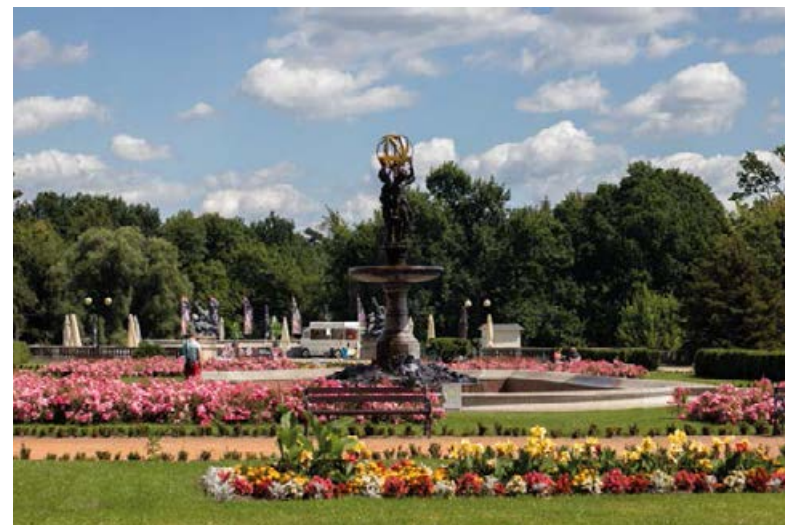
▲ Fontanna w świerklanieckim parku

Tuż obok miejsca po Małym Wersalu znajduje się Pałac Kawalera wzniesiony w 1905 r. dla cesarza Wilhelma II, który często odwiedzał te okolice, by zapolować. Budynek w neobarkowym stylu zdobi łaćcińska inskrypcja: Memento vivere (Pamiętaj o życiu), a w jego wnętrzu mieszczą się restauracja i hotel. Jego wygląd świadczy o guście Donnersmarcków, a tym samym każe ubolewać nad stratą Małego Wersalu.