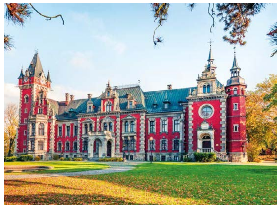
↗ Pałac w Pławniowicach