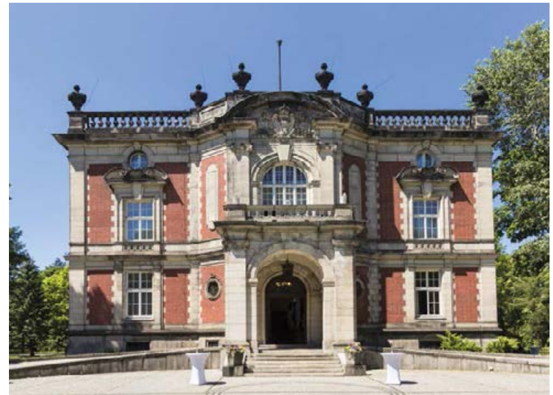
↗ Pałac Kawalera

Na terenie parku w Świerkłańcu mieści się Kajakownia (pn.–pt. 16.00–18.00, sb.–nd. 10.00–12.00).