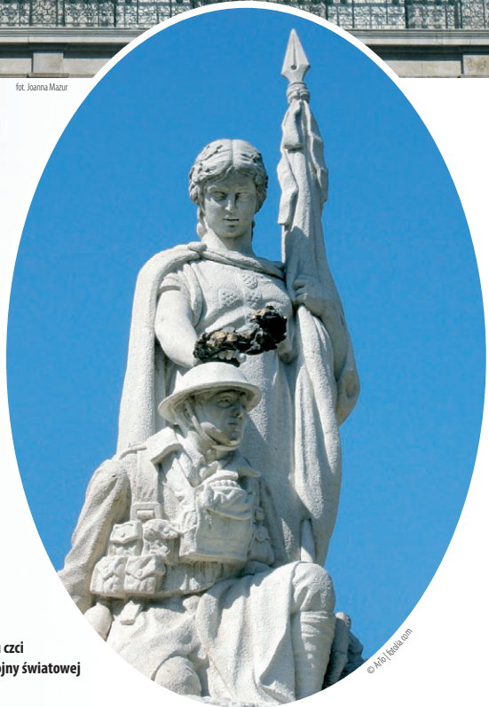
Avenida da Liberdade – pomnik ku czci żołnierzy poległych w bitwach I wojny światowej