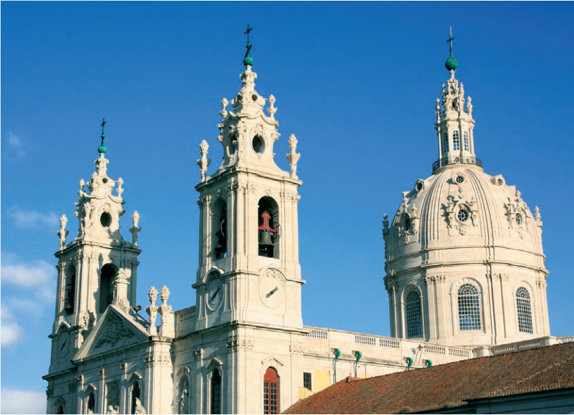
Basilica da Estrela