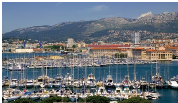
Port w Tulonie

Do muzeum prowadzą imponujące XVIII-wieczne drzwi ze statkami Marsa po lewej stronie i Bellony po prawej. Po wejściu odwiedzający znajdują się przed Quai de l'Artillerie i starym arsenałem – temat tego dużego fresku został zaczerpnięty z obrazu (XVIII w.) autorstwa Josepha Verneta. Na parterze znajdują się modele w dużej skali, przedstawiające fregatę „la Sultane” oraz XVIII-wieczny statek „Duquesne”. Ciekawa kolekcja modeli statków i łodzi podwodnych od XIX w. do czasów obecnych.