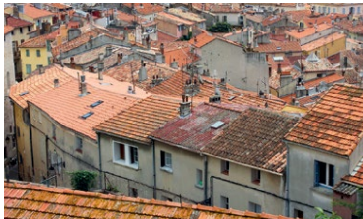
Stare Miasto Hyères

Zamek w Hyères przeszedł z rąk panów Fos w ręce hrabiów Prowansji, którzy przebudowali go w XIII w. Ruiny są dość duże, zwłaszcza wieże i blankowany donżon, który dominuje nad miastem. Roztacza się z niego ładny widok ★ na wybrzeże.