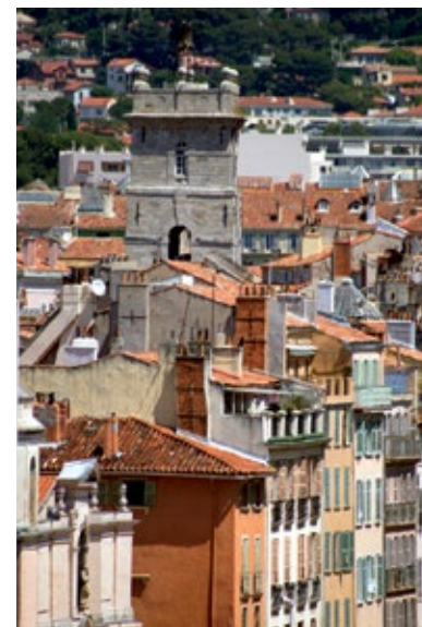
Uliczka starego Tulonu

Ten mały kościół został zbudowany w 1744 r. Posiada fasadę z podwójnymi łukami i genueńską dzwonicę typową dla nicejskiego baroku.