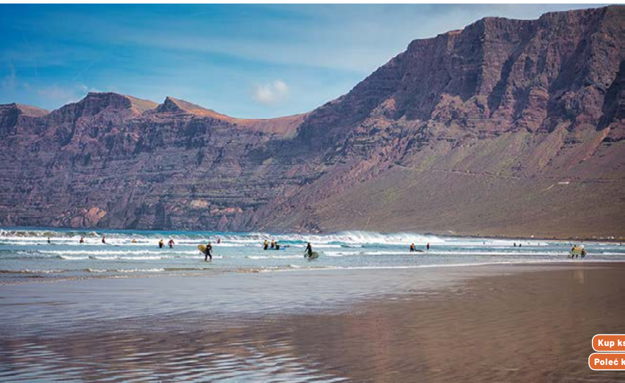
♠ Playa de Famara

Playa de Janubio – dzika, wulkaniczna, z czarnym piaskiem. Piękna, ale raczej do spacerów niż kąpieli.