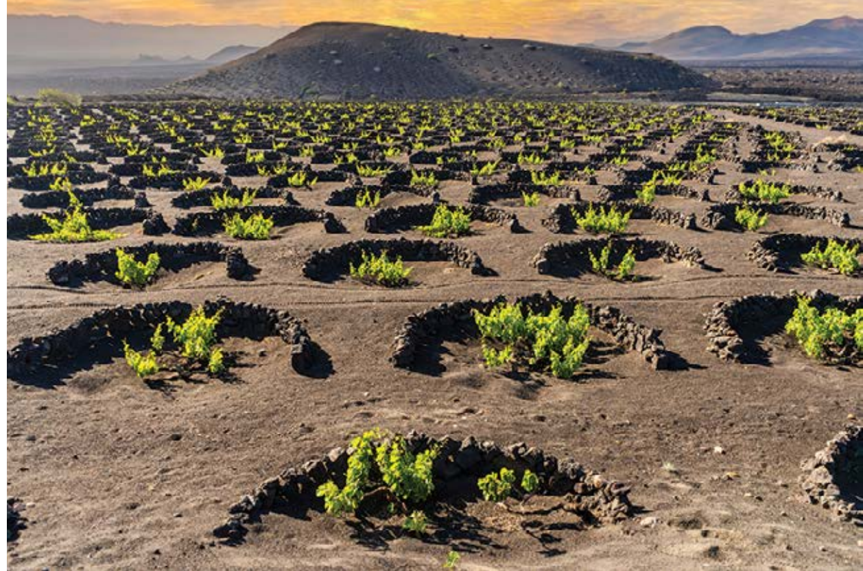
♠ Bodega La Geria

Playa Quemada – kameralna, ciemna plaża w małej rybackiej wiosce, świetna na ucieczkę od tłumów.