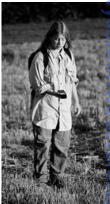
Ustalanie pozycji za pomocą GPS: urządzenie należy trzymać z dala od siebie, aby nie „zasłaniać” satelitów.

Z tej dokładności jednak do 2 maja 2000 r. nie mógł korzystać cywilny użytkownik, gdyż była ona redukowana przez zmienne fałszowanie sygnałów (Selective Availability): wskazywana pozycja przez 95% cza-