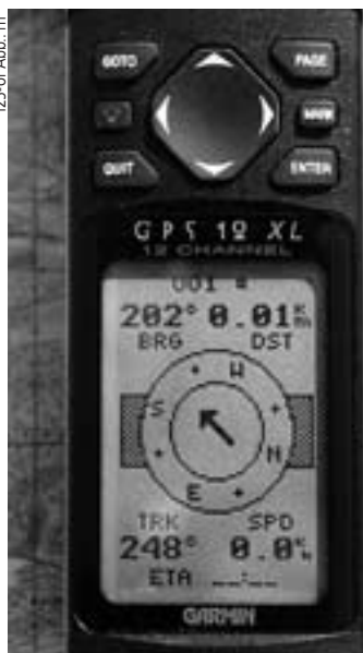
Garmin GPS 12 XL ze strzałką nawigacyjną.