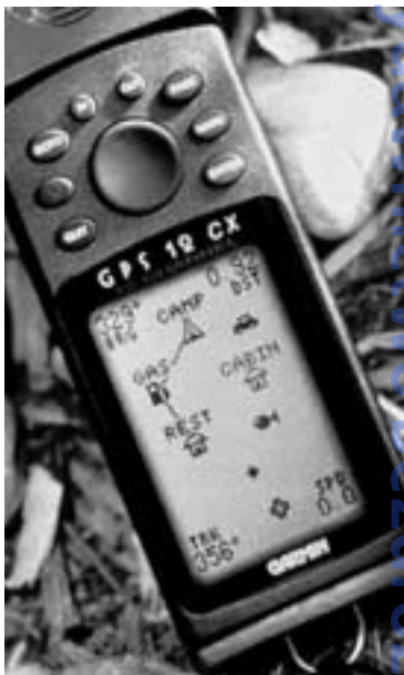
Ekran ze szkicem trasy, ikonami oznaczają- cymi punkty trasy oraz danymi namiaru (BRG), aktualnym kursem (TRK), odległościami do następnego punktu trasy (DST) i aktualną prędkością (SPD).

Opcje menu testowanych przez au- tora urządzeń (zob. Porównanie pod- ręcznych urządzeń GPS ) tylko nie- wiele się różnią pod względem funk- cji podstawowych. W celu opisanja podstawowych funkcji i opcji urzą-