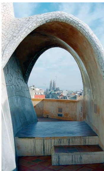
Sagrada Família z dachu Casa Milà.

W kamienicy mieszczą się Instytut Amatller i Centrum Modernizmu, biuro informacyjne organizujące wystawy czasowe i zwie-