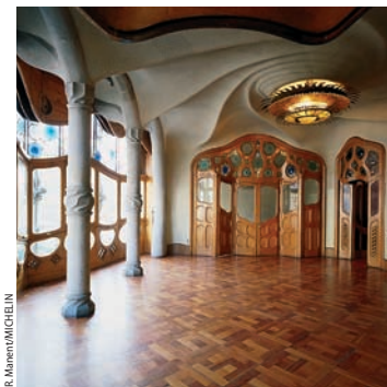
Wnętrze Casa Batlló.

Casa Batlló ★★ – Kamienica, będąca jednym z najważniejszych dzieł Gaudiego, powstała w latach 1904–06, gdy jego styl osiągnął pełnię artystycznej dojrzałości. Fasada pokryta jest drobnymi kolorowymi płytkami ceramicznymi oraz szklanymi, a dachówki na zaskakującym swym kształtem dachu układają się we wzór łusek. Ze względu na oryginalne otwory wejściowe i okienne parteru budowla określona została swego czasu dość żartobliwie „kamienicą kości lub ziewającym domem”. Wnętrze budynku w niczym nie ustępuje jego wygląadowi zewnętrznemu, ośniewającemu dynamiką linii oraz bogactwem obrazów i kolorów. Gaudí rozbił regularne, proste linie przestrzeni, by stworzyć dzieło niezwykle spójne pod względem estetycznym, a przy tym odznaczające się wyjątkowym pięknem. Schody, dach, wewnętrzne dziedzińce, elementy wykończeniowe okien i drzwi, architektura światła – wszystko tutaj zostało pomyślane i zaplanowane w najdrobniejszym szczególe, by móc, niczym pojedynczy element puzzli, wkomponować się idealnie w całość, w ów niezwykły świat wyobraźni, czerpiący swe wzory bezpośrednio z natury.