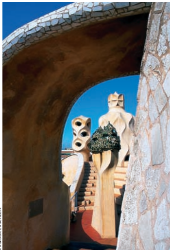
J. M. BARRUT/M. K. REIN

Na półpiętrze znajduje się również sala, w której prezentowane są wystawy czasowe.