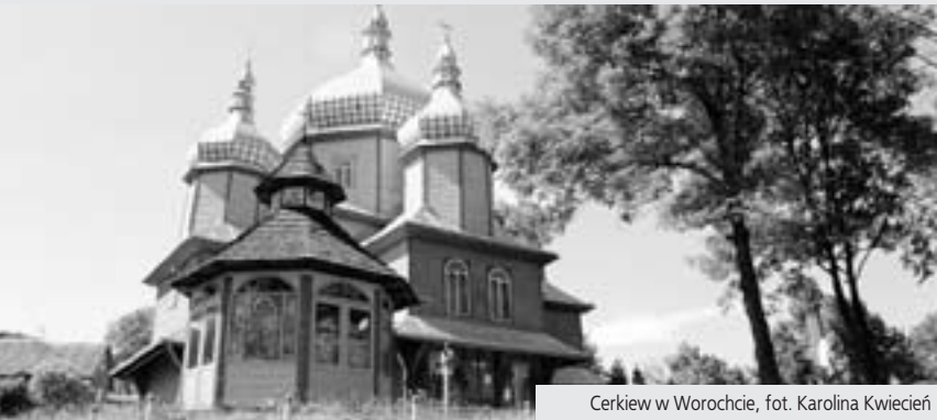
Cerkiew w Worochcie