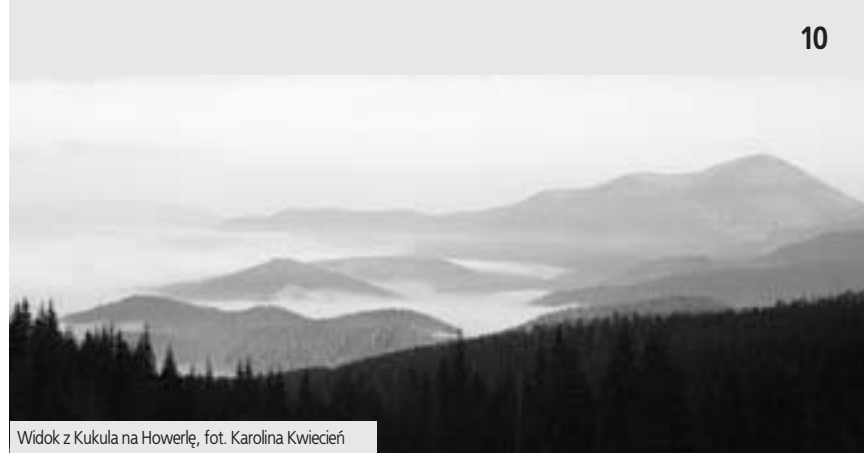
Widok z Kukula na Howerlę, fot. Karolina Kwiecień

(оз. Несамовите) oraz na Howerlę (zob. trasa 11, s. 58) lub przejść łatwą ścieżką do zakarpaciej Łazeszczyny (Лазещина, opis w przeciwnym kierunku, zob. trasa 13, s. 66). Przed wojną było tu piękne, duże i jak na owe czasy bardzo nowoczesne Schronisko im. H. Hoffenbauera, zwane potocznie właśnie Zaroślakiem. Niestety, w czasie wojny doszczętnie spłonęło. Dzisiejsza turbaza nosi tę samą nazwę co przedwojenna poprzedniczka i również jest duża. Tu podobieństwa się kończą. Zaroślak nie jest bowiem ani ładny, ani nowoczesny, ani nawet wygodny. Pokoje są drogie i nieprzyjemne, w dodatku nie zawsze udostępniane turystom, bo oficjalnie jest to baza olimpijska. Status ten zależy od liczby gości i od aktualnego kierownictwa. Jeśli szala przechyla się w stronę schroniska, chętnie przyjmuje się turystów, natomiast jeżeli przeważa wersja bazy olimpijskiej, to w żadnym wypadku. Nie ma też co liczyć na posiłek czy chociażby herbatę w stołówce. Tak czy inaczej, Zaroślak pieczołowicie pielęgnuje radziecką spuściznę i jest miejscem niesympatycznym. Jeśli kogoś przerazi ten monumentalny gmach lub zniechęca go ceny i warunki, może podejść 20 min w stronę Jeziorka Niesamowitego (оз. Несамовите trasa 11, s. 58) i zanocewać w stacji botanicznej albo meteorologicznej pod Pożyżewską (Пожижевська), funkcjonujących już ponad 100 lat (historia badań naukowych pod Pożyżewską – zob. trasa 23, s. 102). Cena będzie niższa, a atmosfera z pewnością sympatyczniejsza.